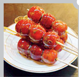
臭豆腐 Fermented Tofu