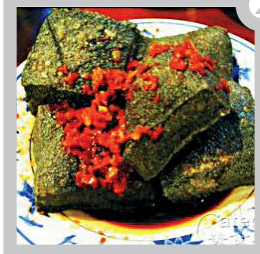
麻花 Chinese Dough Twist