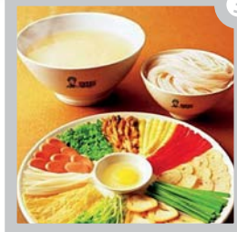
冰糖葫芦 Crispy Sugar-Coated Fruit on a Stick